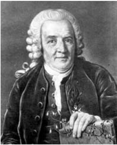
Карл фон Линней

состоянии вернуть природе то, что принадлежит природе, и духу – то, что принадлежит духу. Природе предоставляется самой объяснять свои творения; и дух может погружаться в себя там, где единственно только и можно найти его – внутри человека. – Но хотя Парацельс и мыслит в известном смысле вполне в духе своего времени, однако именно по отношению к идее развития и становления он более глубокомысленно понимает отношение человека к природе. Он видел в существе мира не что-то существующее так или иначе в замкнутой форме, а постигал божественное в становлении. Поэтому он мог приписывать человеку действительно самостоятельно творческую деятельность. Если божественное первосущество уже имеется налицо раз и навсегда, то не может быть речи об истинном творчестве человека. Тогда творит не человек, живущий во времени, но творит Бог, который от вечности. Но для Парацельса нет такого Бога от вечности. Для него есть лишь вечное совершение, и человек есть звено в этом вечном совершении. То, что создает человек, никак не существовало прежде. То, что творит человек, взятое так, как он его творит, есть изначальное творение. Если называть это божественным, то это можно сделать лишь в том самом смысле, в каком оно есть творение человека. Поэтому Парацельс может предоставить человеку такую роль в строении мира, которая делает его самого соучастником-