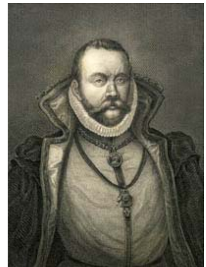
Тихо де Браге