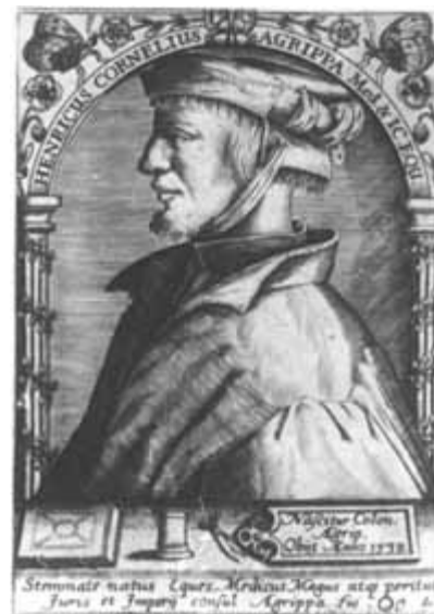
Генрих Корнелий Агриппа